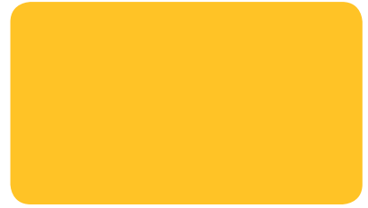
SIGNALGELB SIGNAL YELLOW JAUNE DE SÉCURITÉ