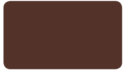
SCHOKOLADENBRAUN CHOCOLATE BROWN BRUN CHOCOLAT