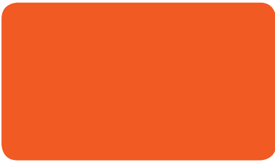
VERKEHRSORANGE TRAFFIC ORANGE ORANGÉ SIGNALISATION