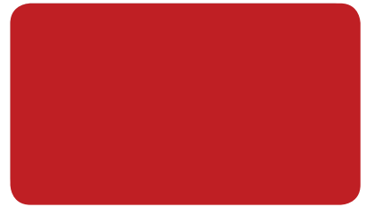
SIGNALROT SIGNAL RED ROUGE DE SÉCURITÉ