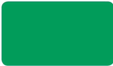
VERKEHRSGRÜN TRAFFIC GREEN VERT SIGNALISATION